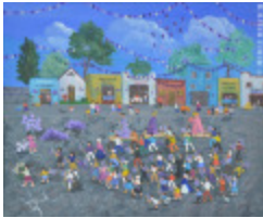
Procession du Vendredi Saint (2013.935)