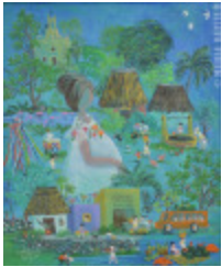
Femme au Yucatan (2013.937)