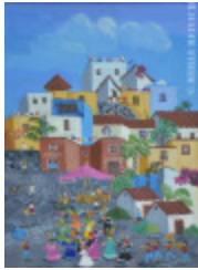
Chinelos au village (2013.930)