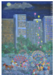
Calèches à Acapulco (2013.921)