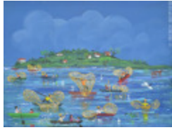
Pêcheurs à filets papillon (2013.928)