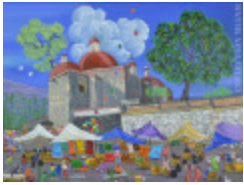
Mitla, Oaxaca (2014.001)