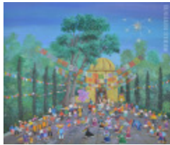
Fête de San Gregorio (2013.920)