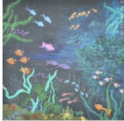
Aquarium nocturne (2013.919)