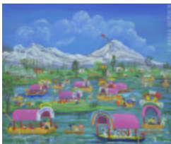
Dimanche à Xochimilco (2013.939)