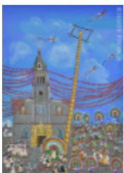
Cuetzalan, État de Puebla (2013.940)