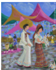
On apporte des fleurs au marché (2013.934)