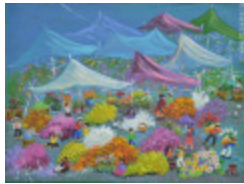
Marché de fleurs (2013.929)