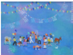
Bénédiction des animaux (2013.941)