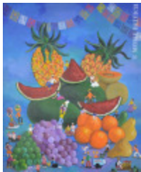
Cueillette de fruits (2013.922)