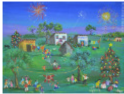
Pinata de Noël (2013.927)