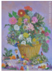
Joie du printemps (2013.931)