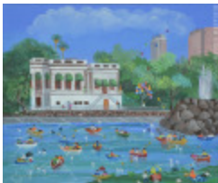
Maison sur le lac (La) (2013.938)