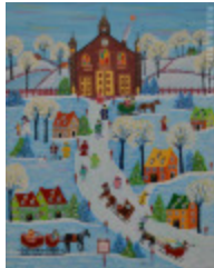
Grand messe du dimanche (La) (2006.078)