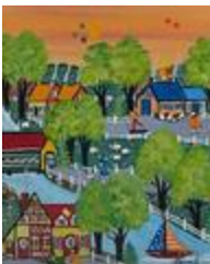
En été (2022.107)