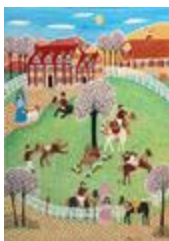
Quand les chevaux s'en mêlent (2022.142)