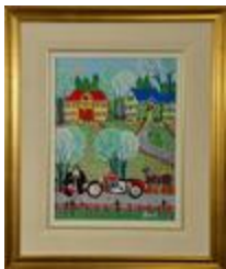
"Vive la moto", Acrylique, 38 X 45 cm, encadrée, 315 $ (2021.527)