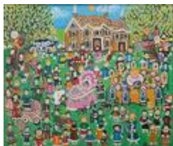
Le baptême (2022.114)