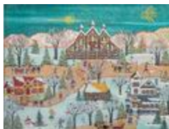
La messe de minuit (2022.113)