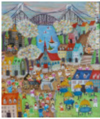
Attraites du Vieux Québec (Les) (2002.097)