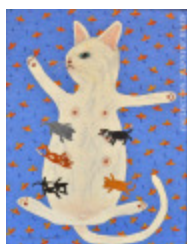
Chatons (Les) (2016.915)