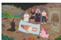
J'aurais aimé être là (XIV- Chemin de la Croix) (2002.176)