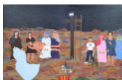
J'aurais aimé être là (XIII- Chemin de la Croix) (2002.175)