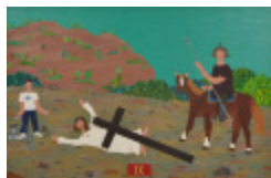
J'aurais aimé être là (IX- Chemin de la Croix) (2002.171)