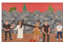
J'aurais aimé être là (V- Chemin de la Croix) (2002.167)