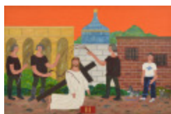
J'aurais aimé être là (III - Chemin de la Croix) (2002.165)