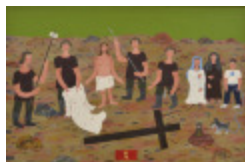
J'aurais aimé être là (X- Chemin de la Croix) (2002.172)