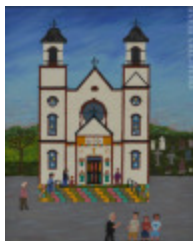
Église Ste-Cécile Nouveau-Brunswick (2002.051)