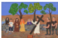
J'aurais aimé être là (VIII- Chemin de la Croix) (2002.170)