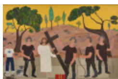
J'aurais aimé être là (II - Chemin de la Croix) (2002.164)