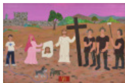
J'aurais aimé être là (VI- Chemin de la Croix) (2002.168)