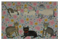
Grosse famille (2006.069)