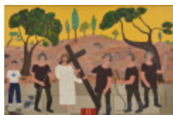
J'aurais aimé être là (II - Chemin de la Croix) (2002.164)