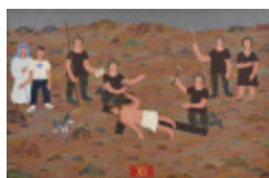
J'aurais aimé être là (XI- Chemin de la Croix) (2002.173)