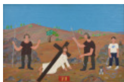
J'aurais aimé être là (VII- Chemin de la Croix) (2002.169)