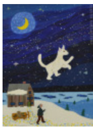
Quêteux (Le) (2002.036)