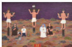
J'aurais aimé être là (XII - Chemin de la Croix) (2002.174)