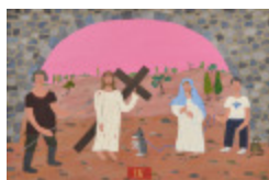
J'aurais aimé être là (IV- Chemin de la Croix) (2002.166)