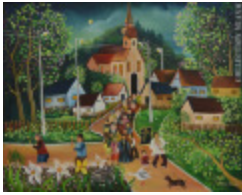
Nuit de Pâques (2002.127)