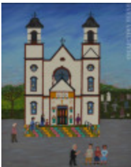
Église Ste-Cécile Nouveau-Brunswick (2002.051)