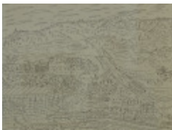
Pulperie de Chicoutimi (La) (2002.109)