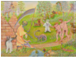
Adam et Ève chassés du paradis terrestre (2002.182)