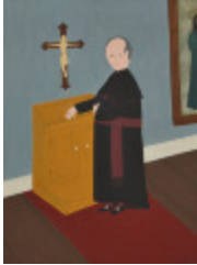
Monseigneur X... p.b. ... (2002.021)