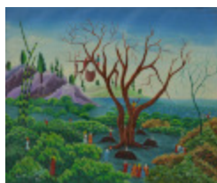
Offrandes vaudous (2006.092)