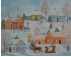
Un hiver québécois (2002.086)