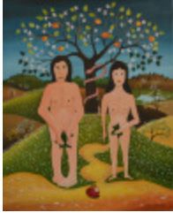
Crés au paradis (2002.128)