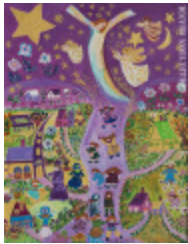
Sainte paix (La) (2003.016)