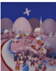
Noce en hiver (2002.056)