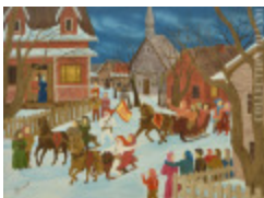
Carnaval (Le) (2002.059)