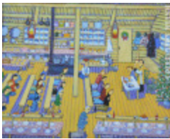
Messe de minuit dans les chantiers (2002.118)