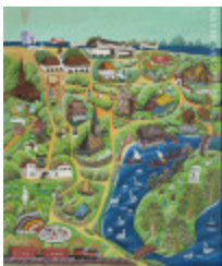
Musée du village roumain (Le) (2002.126)