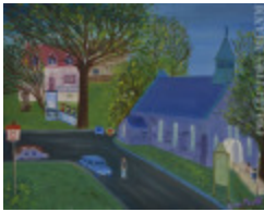
Centre d'art de Lévis (Le) (2002.079)