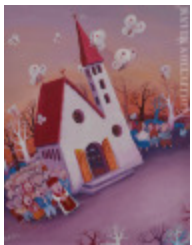
Messe du dimanche (La) (2002.053)