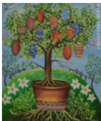
Journée de Pâques (La) (2002.125)