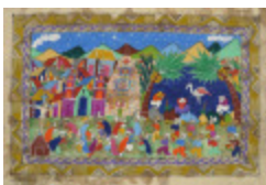
Église et village (2003.043)