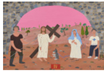
J'aurais aimé être là (IV- Chemin de la Croix) (2002.166)