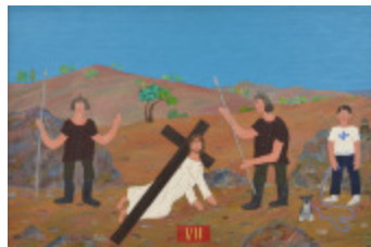
J'aurais aimé être là (VII- Chemin de la Croix) (2002.169)