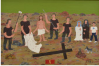
J'aurais aimé être là (X- Chemin de la Croix) (2002.172)