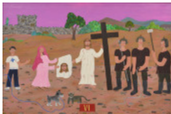
J'aurais aimé être là (VI- Chemin de la Croix) (2002.168)