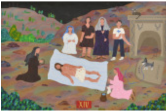
J'aurais aimé être là (XIV- Chemin de la Croix) (2002.176)