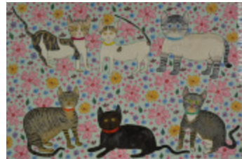
Grosse famille (2006.069)