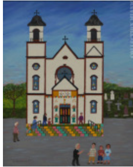
Église Ste-Cécile Nouveau-Brunswick (2002.051)