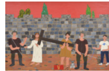
J'aurais aimé être là (V- Chemin de la Croix) (2002.167)