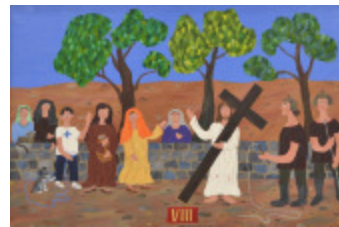
J'aurais aimé être là (VIII- Chemin de la Croix) (2002.170)