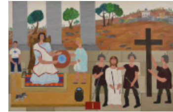
J'aurais aimé être là (I- Chemin de la Croix) (2002.163)