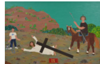
J'aurais aimé être là (IX- Chemin de la Croix) (2002.171)