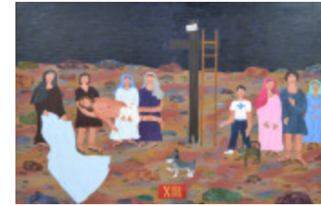
J'aurais aimé être là (XIII- Chemin de la Croix) (2002.175)