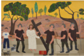
J'aurais aimé être là (II - Chemin de la Croix) (2002.164)