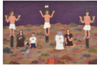
J'aurais aimé être là (XII - Chemin de la Croix) (2002.174)