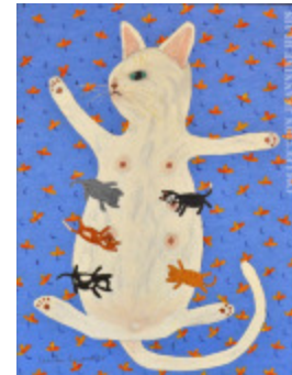
Chatons (Les) (2016.915)