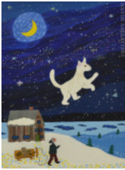
Quêteux (Le) (2002.036)