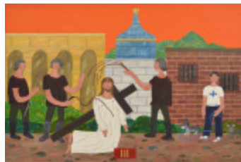
J'aurais aimé être là (III - Chemin de la Croix) (2002.165)