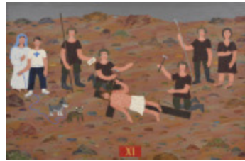
J'aurais aimé être là (XI- Chemin de la Croix) (2002.173)