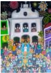
Procession de bonne mort (2020.452)