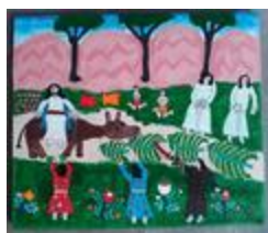
Arrivée triomphale (2020.523)