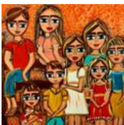
Gardiens à Genipapo (2020.519)