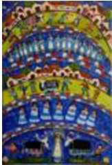
Le taureau Candil (2020.176)