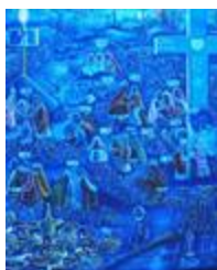
Une vue de Guarabira (2020.202)