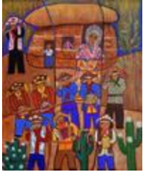
Le fifre rend hommage à Zabé da Loca (2020.500)