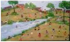
La fontaine de Leonor (Camões) (2020.427)