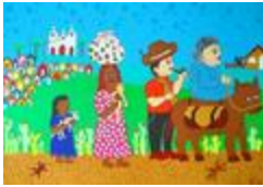
Retirantes, le voyage en bourricot dans le Sertão (2020.146)