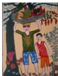
Le marqueteur (2020.141)