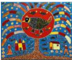
Les oiseaux dans l'arbre (2020.515)