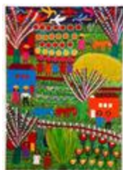
Champ de blé (2020.214)