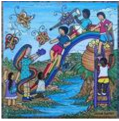
Sans titre (2020.512)