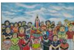
Procession de l'apparition de Notre-Dame (2020.518)