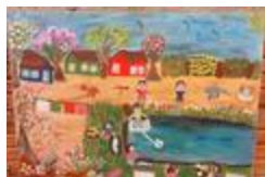
La famille (2020.526)