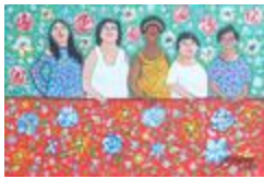
Sans titre (2020.487)