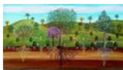
Agro forêt (2020.207)