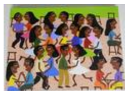
Le Forró de Marieta (2020.191)