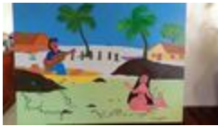
Chant à la sirène (2020.528)