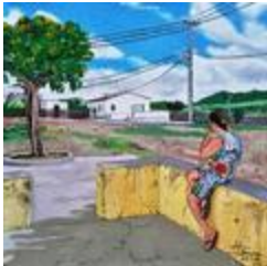
Pause de tâches domestiques (2020.502)