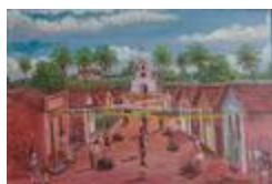
Saint Jean à Pium (2020.464)