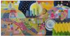
Histoire d'un peuple (2020.446)