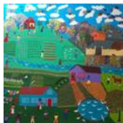
Patchworks de l'intérieur (2020.418)