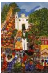
Je pense que c'est peu (2020.505)