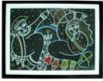
Lampião et Maria Bonita (2020.443)