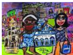
Univers de rêve (2020.521)