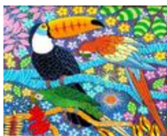
Toucan, Ara et perroquet (2020.163)