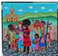
La beauté et la force des femmes du Nord Est (2020.137)