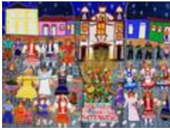
Queima da Lapinha - Das meninas (2020.499)