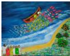
La pêche miraculeuse (2020.401)