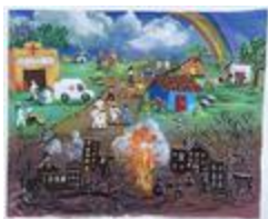
De l'aide pour nos familles (2020.361)