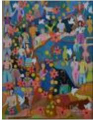
Diversité 1 (2020.216)