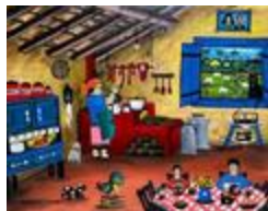
Petit déjeuner à la campagne (2020.197)