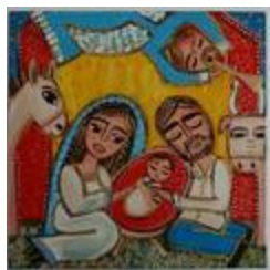
La nuit qui a changé le monde (2020.520)