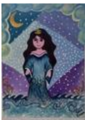
La reine de la mer (2020.442)