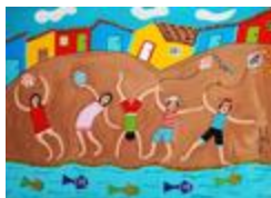
Jeux d'enfants I (2020.156)