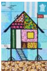
Habitation du bord de l'eau (2020.495)