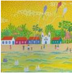
Village des Açores sur l'île de Santa Catarina (2020.215)