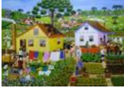
Colonie polonaise (2020.144)