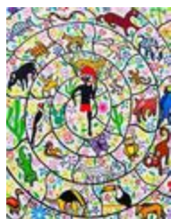
Saci dans les jardins d'animaux (2020.167)