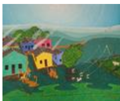
Un jour après l'autre au village (2020.161)