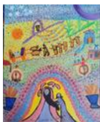
Les bienheureux du père Cícero (2020.213)