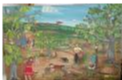
Récolte de Pequi (2020.165)