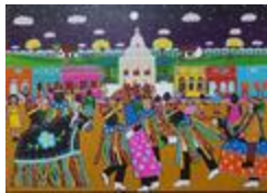
Fête des Rois (2020.404)