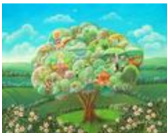
Meilleurs souhaits (2020.504)