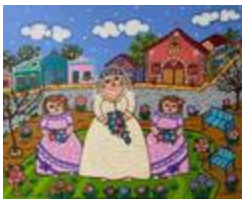
La mariée du village (2020.451)