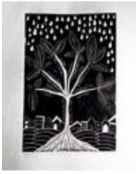
Il fleurira! (2020.143)