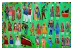
Manifestations populaires II (2020.471)