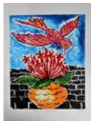
L'oiseau rouge (2020.400)