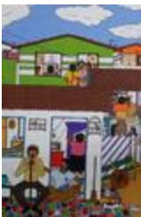
Communauté de la patrie (2020.217)