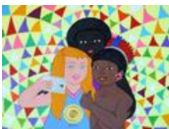
être humain (2020.497)