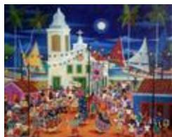
Reisado et le Jaraguar (2020.473)