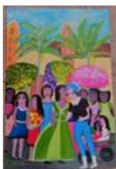
Ne me quitte pas, mon amour (2020.222)