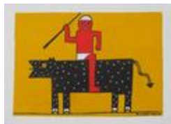
Le Curupira (2020.201)