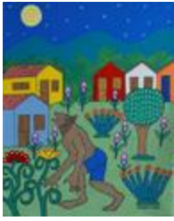
Le Lobisomem dans le village (2020.170)