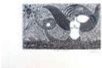
Sirène ailée (2020.220)