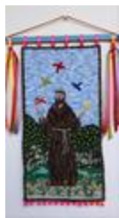
Saint François (2020.181)