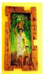
Voilà Maria (2020.482)