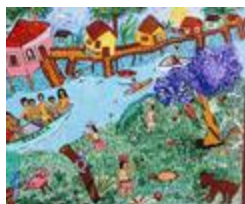
Sur les rives de l'Amazone (2020.459)