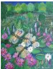
Les libellules (2020.152)