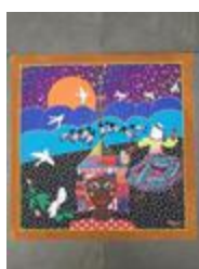
Cirque ailé (2020.166)