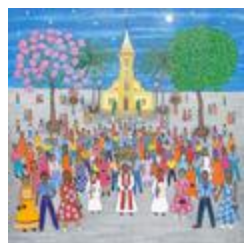
Fête de N. S. de Perpetuo Socorro (2020.189)