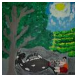
O menino parteiro (2020.524)