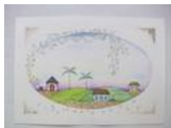
La vigne assortie (2020.209)