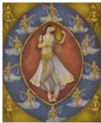
Ballet La Bayadère- Moments de l'univers (2019.022)