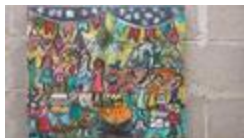
La fête (2020.405)