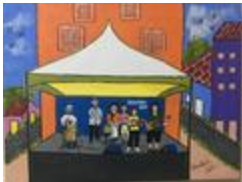
Sabadinho bom - spectacle de Zé Catimba (2020.529)