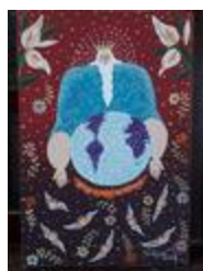
La présence de Dieu (2020.192)