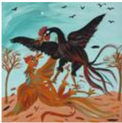
Le combat de coqs, une pratique très courante mais illégale (2020.434)