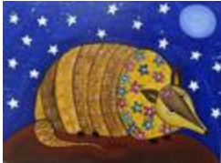
Dans la série des animaux en voie d'extinction: Tatu Bola (2020.448)