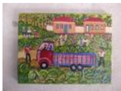
Récolte de pastèques (2020.411)