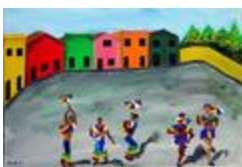
Frevando dans la ville (2020.510)