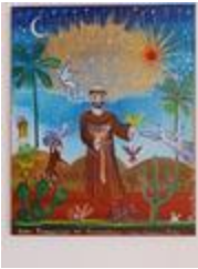
Saint François (2020.151)