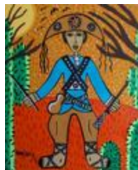
Le Cangaceiro (2020.422)