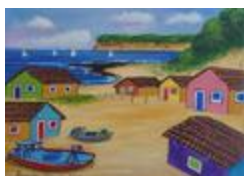
Village de pêcheurs (2020.410)