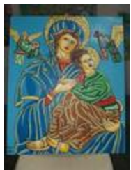
Notre Dame de l'aide perçue (2020.154)