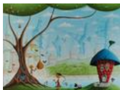
...encore mieux à la maison (2020.228)