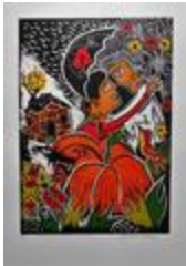
Hommage à nos grands peintres naïfs (2020.439)