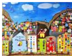
Église de samba (2020.187)