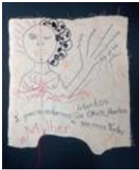
Cœur qui bat (2020.174)