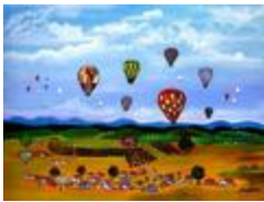
Tour de balon (2020.490)