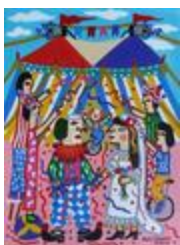
Le mariage du clown (2020.407)