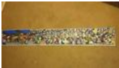
Caruaru, capitale du Forró (2020.149)