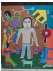
Le visage de mon toron (2020.440)