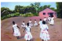
La danse du coco en campagne (2020.509)