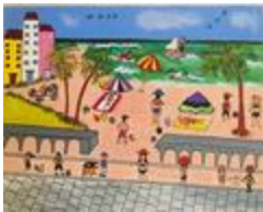
Une plage de Olinda (2020.530)