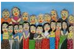
Des gens envieux (2020.517)