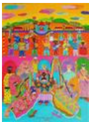
Rencontre des Congados 1 (2020.194)