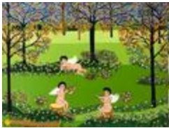
Le jardin des anges (2020.492)