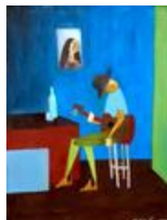
Le guitariste de Minas Gerais (2020.223)