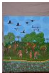
Propriétaires de la forêt (2020.159)