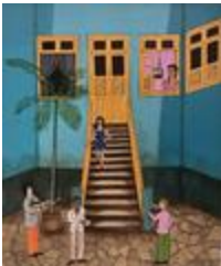
Sérénade au clair de lune (2020.178)