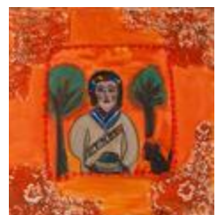
Maria Bonita (2020.481)