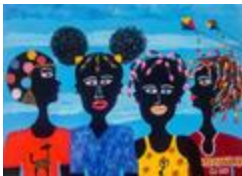
Enfance III (2020.219)