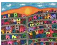
La ville colorée (2020.460)