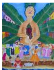
Bananeira qui a déjà tant donné (2020.210)