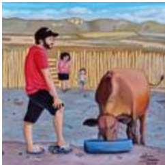
La ration de la vache MImosa (2020.501)