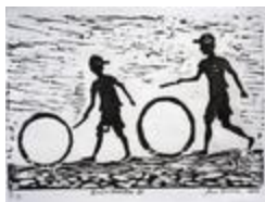
Jeu d'enfant I (2020.413)