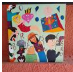
Le peuple du Brésil (2020.136)