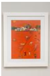
jeux dans l'île (2020.416)