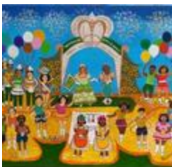
Hommage à Zé Katimba (2020.221)