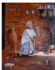
La femme à la pipe (2020.205)