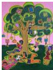
Arbre de la connaissance (2020.135)