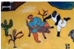
Enfant ingénieux (2020.456)