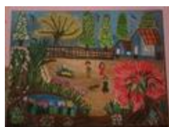
La balade (2020.525)