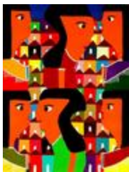
Les curieuses (2020.493)