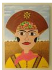
Frida la Cangaceira (2020.419)