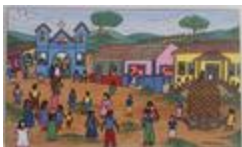
Jour de messe (2020.511)