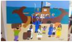
Le bateau Catarineta (2020.527)