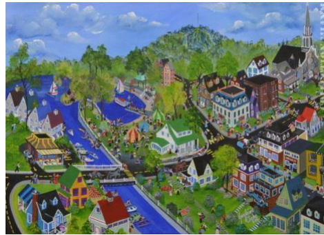
Une société, une histoire , Guylaine Cliche (Canada)