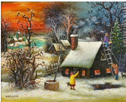
Les ramoneurs , Dragan Mihailovic (Serbie)

Collectionner - Faire découvrir - Partager